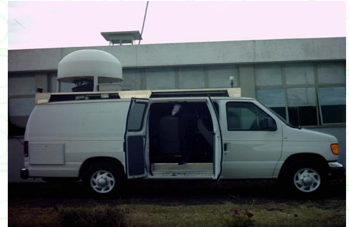
ከፍተኛ ወጪ ወጥቶበት የተገዛው ሱሉልታ የሚገኘው የፍራኩዌንሲ ሞኒተሪንግ መሣሪያ