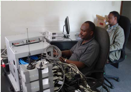
የቴክኒክ ብቃት ማረጋገጫ አሰጠኞች በሥራ ላይ